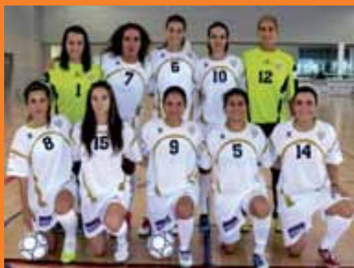
Plantilla Valladolid FSF.

La Tercera, la llamada anteriormente Primera B, sigue siendo de ámbito regional. 17 equipos la forman este año en Castilla y León.