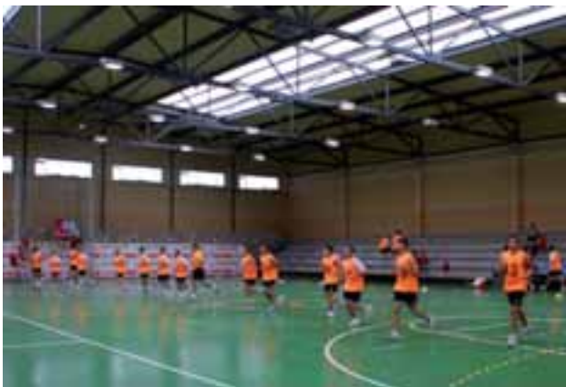
Pruebas físicas para los colegiados de fútbol sala.