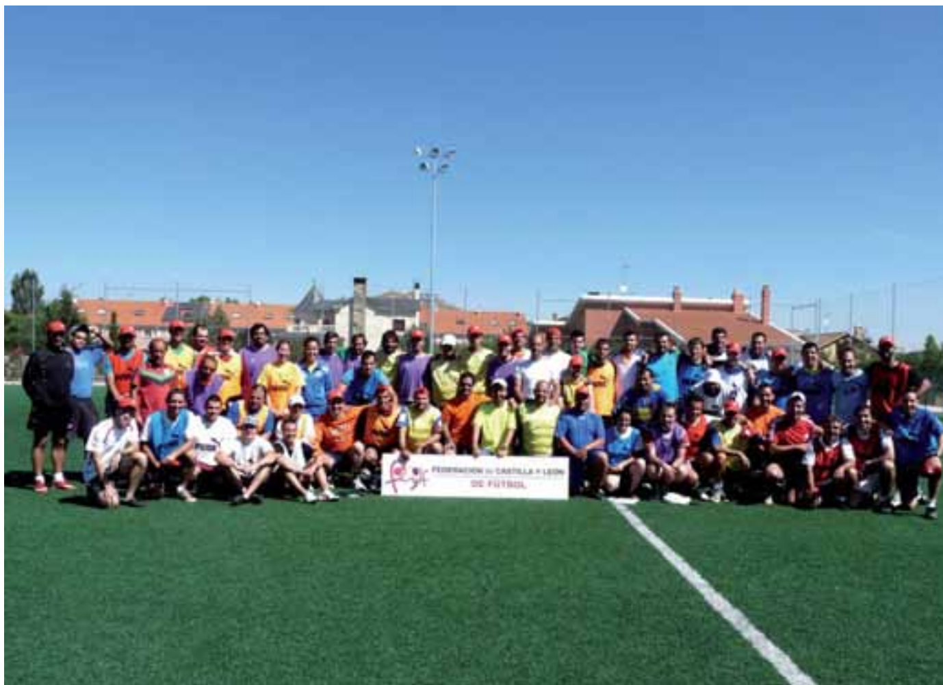
Alumnos del curso Nivel 2 de 2011.

Ya ha comenzado el curso para casi todos aquellos que se rigen por un calendario académico, y también lo ha hecho para los alumnos de la Escuela de Entrenadores de la Federación de Castilla y León de Fútbol. Se cumple un año desde el cambio en la dirección de la misma, con Luis Díaz al frente. Durante estos 12 meses han pasado por las aulas de la sede de la FCyLF y de sus delegaciones provinciales 262 alumnos y se han cimentado las bases de un nuevo modelo de funcionamiento para cursos venideros.