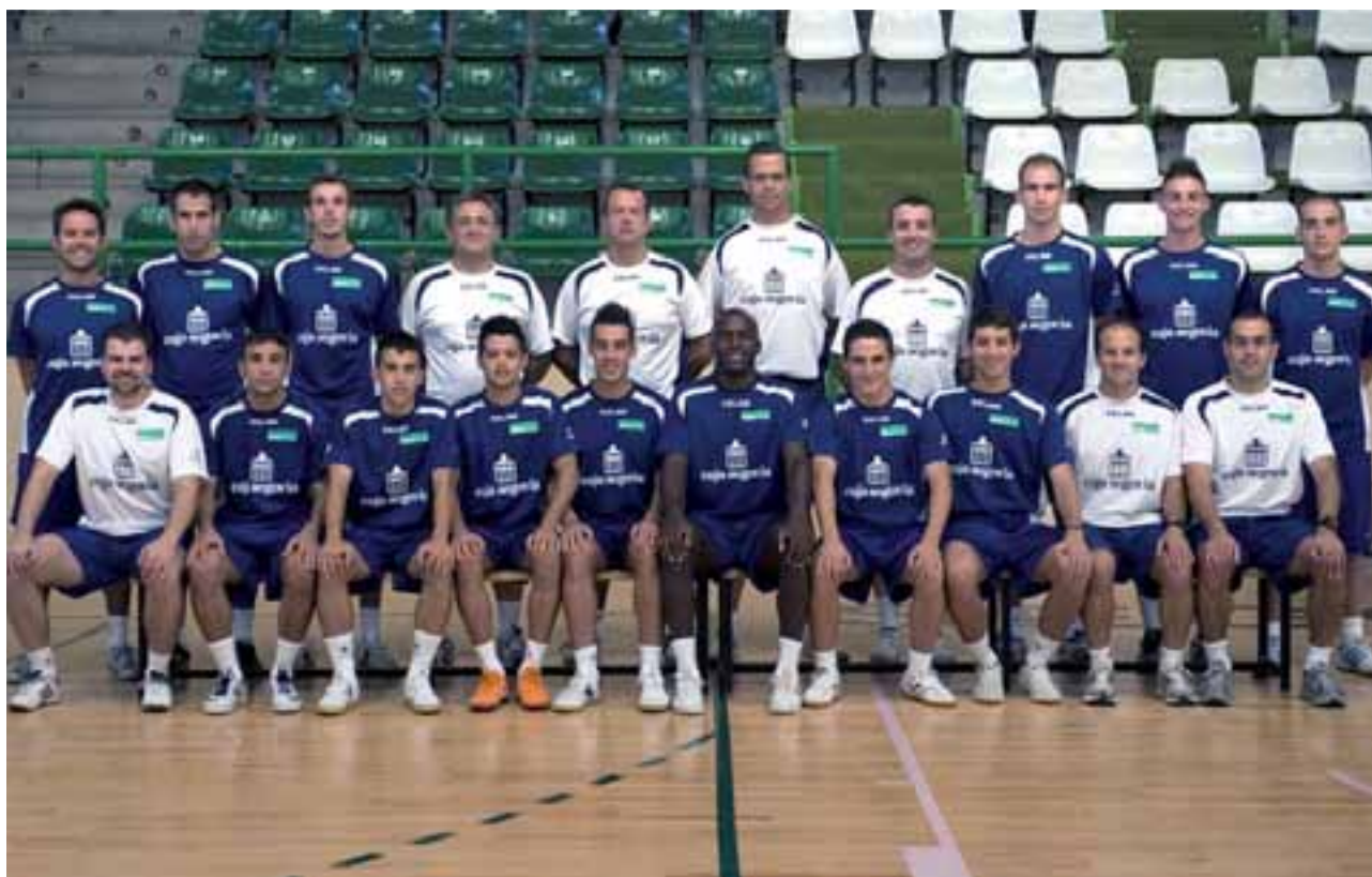
Plantilla Caja Segovia FS.

Pero no sólo de la categoría masculina vive el fútbol sala castellano y leonés. En la femenina, el Valladolid FSF se mantiene una temporada más en la elite, en la Primera Femenina; mientras que el Universidad de Salamanca, el Unami (Segovia), Chozas Abajo (León) y el Samura (Zamora) militarán en el grupo IV de Segunda. Catorce equipos buscarán la gloria en el grupo regional del fútbol sala femenino.