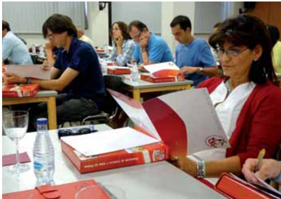
Reunión de principio de temporada con todos los miembros del Centro.

Igualmente y, por tercer año consecutivo, la Federación de Castilla y León de Fútbol ha convocado su particular escuela para los jóvenes colegiados de la Comunidad. Con