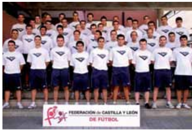
Árbitros de fútbol con la indumentaria de calentamiento PONY.

El Comité Técnico de Árbitros de la FCyLF convocó en los meses de agosto y septiembre a todos los árbitros colegiados esta temporada. Bien en las delegaciones provinciales o en el propio Comité regional, los árbitros se han sometido a estas pruebas.