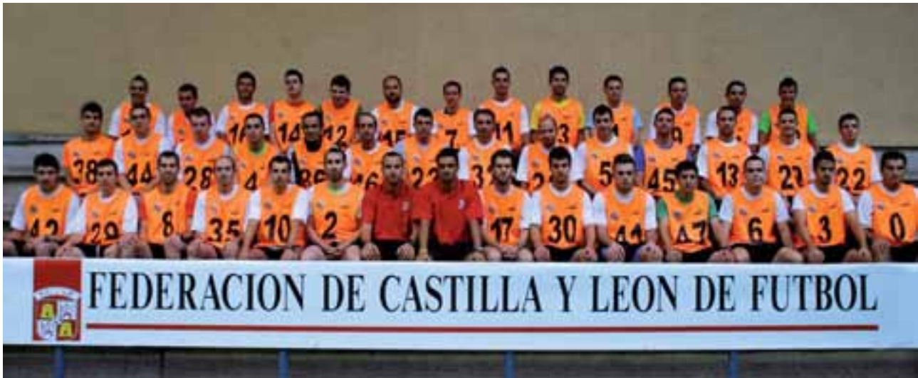
Árbitros de fútbol en las pruebas de principio de temporada.