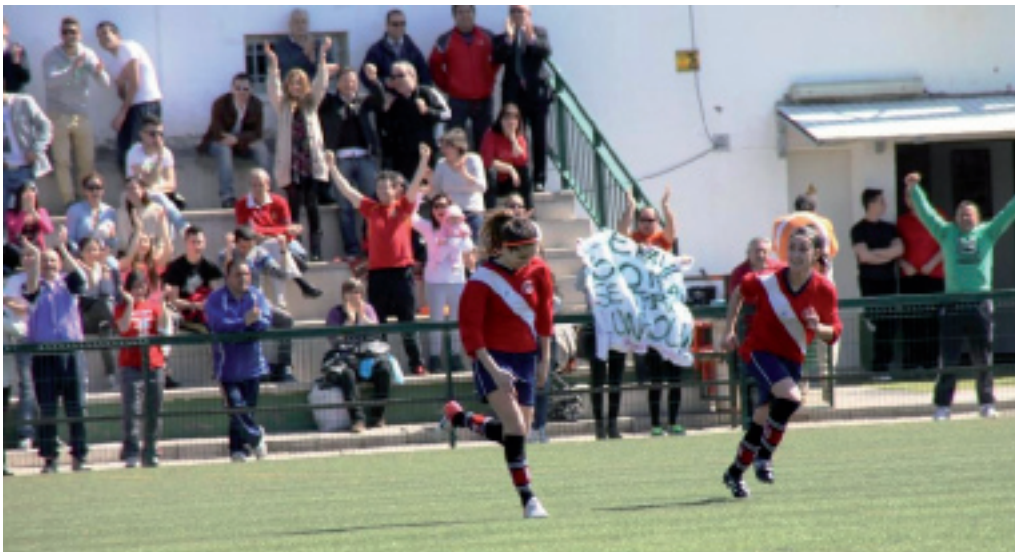
El Rayo Simancas celebra el último gol frente al Ntra. Sra. de Belén en el duelo por la permanencia

Peor suerte han corrido otros cinco equipos, que caen a Regional Juvenil. Sorprendentes son los descensos de Burgos Promesas y Zamora, que el año pasado competían en División de Honor y el que viene lo harán dos divisiones más abajo, arrastrados por los descensos desde División de Honor. Además de burgaleses y zamoranos, Atlético Bembibre, Quintanar-Palacio y Victoria CF pierden igualmente la categoría.