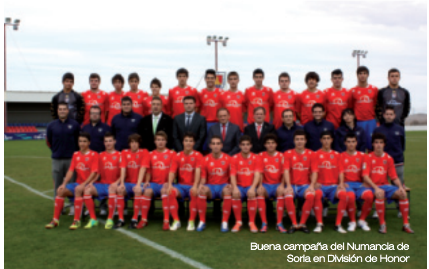
Buena campaña del Numancia de Soria en División de Honor

Buena temporada del Numancia en el Grupo II de División de Honor. Sexto con 44 puntos, los numantinos han acabado por detrás de ilustres como el Athletic, campeón; el Osasuna o la Real Sociedad. En mitad de tabla, octavo, ha terminado la campaña el Valladolid en el Grupo V, donde el Santa Marta y el Salamanca han sido las grandes decepcio-