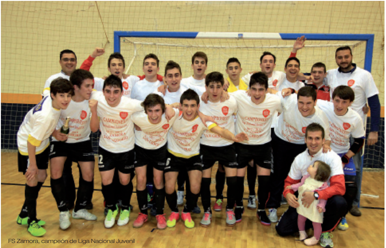
FS Zamora, campeón de Liga Nacional Juvenil

de Medina del Campo cayendo a Provincial. Espinar, Benavente, Zarzuela, Salamanca, Venta de Baños, La Bañeza, Guijuelo, Arroyo de la Encomienda, Burgos, Cabezón, Ciudad Rodrigo y Medina del Campo han disfrutado del fútbol sala regional.