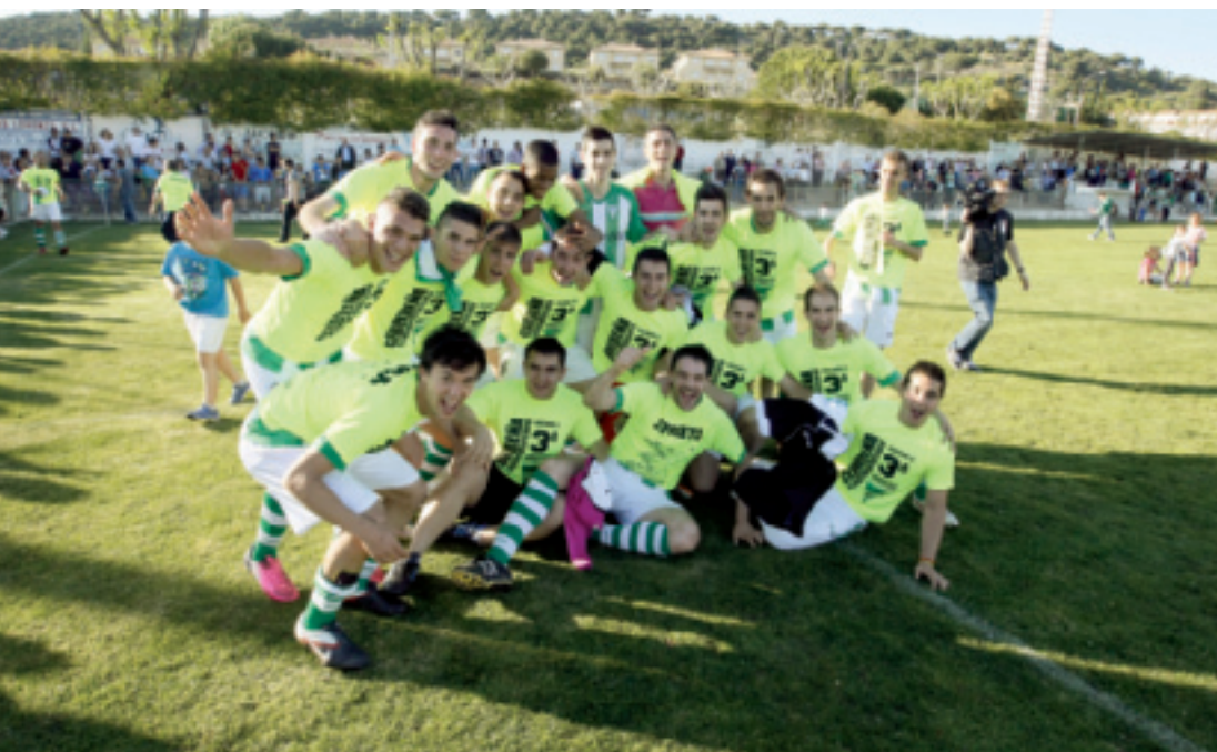
Ascenso del CD Cebrecerña a 3ª División

hecho ocupar uno de los tres puestos de descenso directo. También baja el Cuéllar Balompié, que ha pagado su falta de experiencia en Tercera División y que tan solo había sumado nueve puntos. El tercer puesto de descenso directo trataron de evitarlo seis clubes: Almazán, Unami, Salamanca B, Racing Lernerño, Villaralbo y Santa Marta. Los sorianos son quienes mejor lo tuvieron para salvarse, igual que el recién