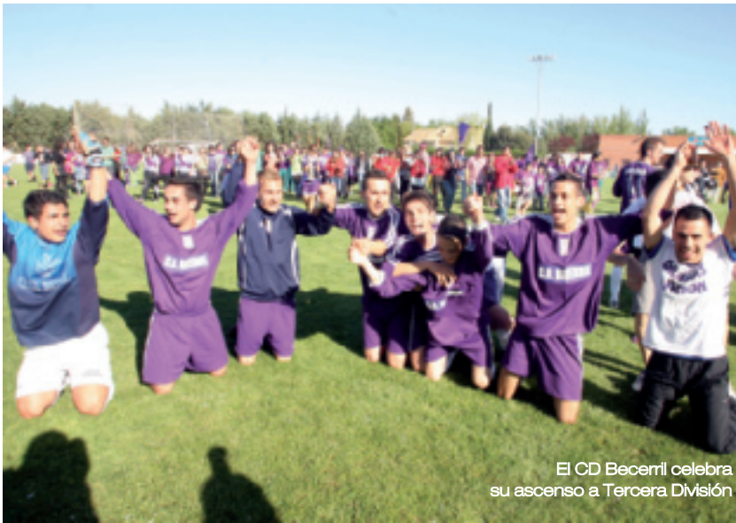
El CD Becerril celebra su ascenso a Tercera División

nes. Los dos representantes salmantinos en la máxima categoría juvenil han acabado entre los cuatro últimos de su grupo y descienden a Liga Nacional.