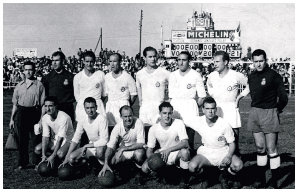
Equipo que ascendió a Primera División, en el campo de El Ejido.

mente dos puntos, los que durante la mayor parte de la historia del fútbol se daban por una victoria. En la antepenúltima cita todos los candidatos a esos puestos ganaron, por lo que se mantuvo la situación. Oviedo era el destino leonés en la penúltima jornada. Los ovetenses estaban a tres puntos de los leoneses y recortaron esa diferencia al ganarles por 3-1, pero la derrota del Gijón fue clave para afrontar el último partido con un punto sobre el Oviedo y el Zaragoza y dos sobre el propio Real Gijón. Como se ve muchas cosas podían suceder en ese último partido, pero la Cultural contaba con la ventaja de disputarlo en su campo de El Ejido. El rival era el Real Avilés, situado en la parte baja de la tabla y que necesitaba puntuar en León para no perder la categoría. Los culturalistas eran los únicos que dependían de sí mismos al ser los mejor colocados y tener más puntos que el resto. Los demás, para conseguir