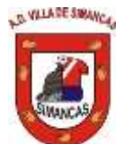
C.D. VILLA DE SIMANCAS